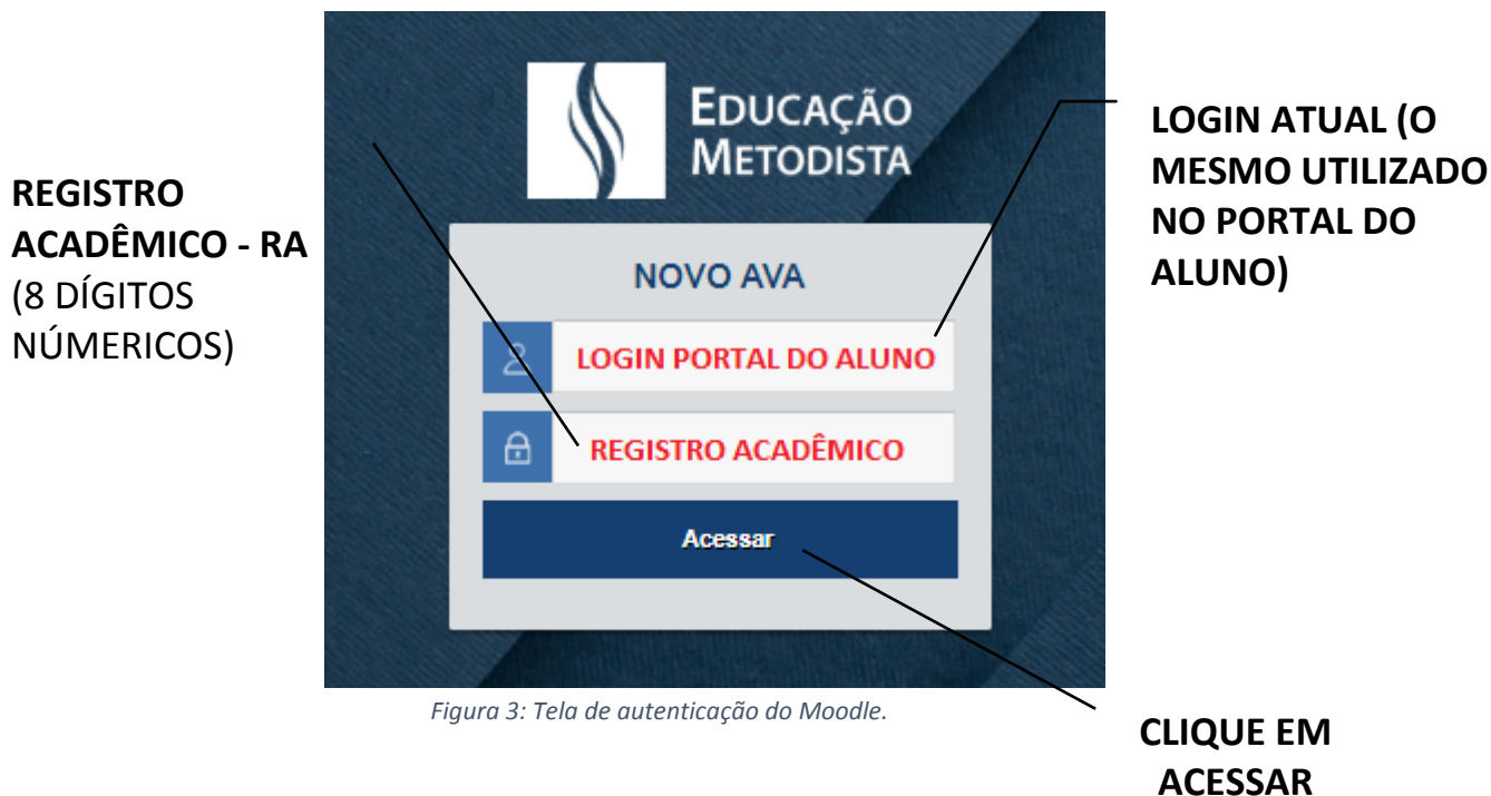
Figura 3: Tela de autenticação do Moodle.

Como já foi falado anteriormente, para acessar a nova versão do Moodle é necessário utilizar o login atual (o mesmo utilizado no Portal do Aluno) e a senha para o primeiro acesso é o Registro Acadêmico (RA) do estudante.